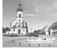
Paroisse St Etienne ROUHLING