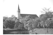
Paroisse St Innocent GROSBLIEDERSTROFF

Cher paroissien, notre diocèse est dans la joie !