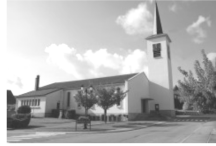
Paroisse St Maurice LIXING