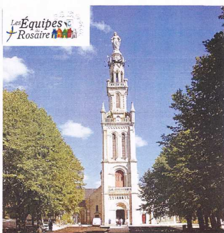
Les équipes du Rosaire vous invitent à SION

Journée pastorale diocésaine pour les enfants de CP au CM2